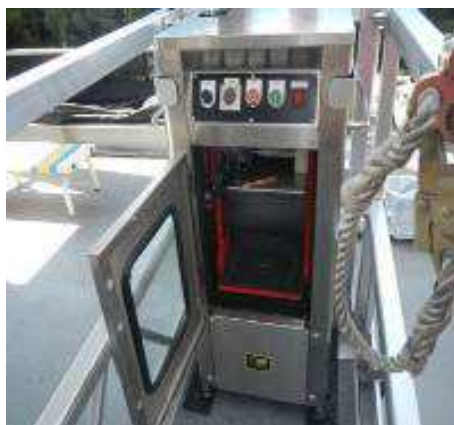
仮設ゴンドラに設置した「オルタック Vibra システム」

「オルタック Vibra システム」は、コンパクトな高速振動機を直接ゴンドラに設置し、密閉型の缶をセットするだけで自動混合が完了する画期的なシステムです。硬化剤入りの9L缶に主剤を投入し、缶の蓋を閉めて高速振動機にかけるだけ。プロペラ型電動攪拌機に比べ、周辺を汚すことも少なく、クリーンな作業環境を保ちます。混合攪拌のたびにゴンドラから降りる必要がないので、作業効率の飛躍的な改善が期待できます。