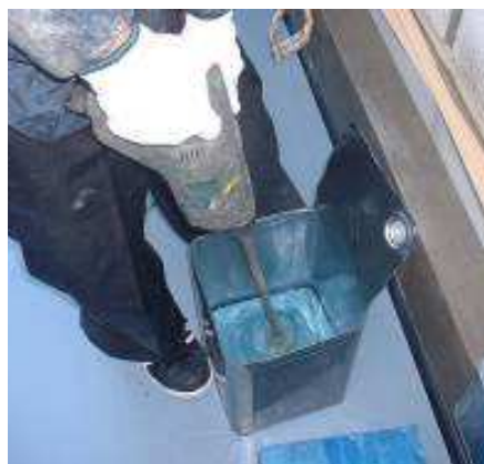
写真右:通常の混合攪拌作業