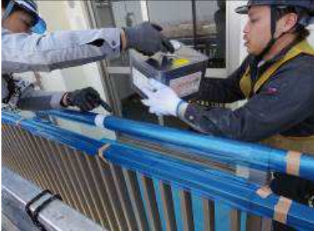
混合した缶を蓋をしたまま運搬

混合が終了したら、缶を取り出してバルコニー側の技能員に手渡しします（蓋が閉まったままなのでウレタン防水材料をこぼす心配がありません）。そのまま施工部位まで運び、蓋を開封するか、缶の隅をくり開き防水材料を流して塗り広げるだけですので、クリーンな環境を保ちながら手早い作業で、施工がスムーズに進行します。