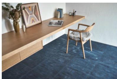
経年変化前・変化後の使用イメージ

「従来の建築仕上げ材の多くが実現できなかった劣化 ではなく経年変化を楽しむという新しい価値観を商 品に結実させた点」が評価されました。